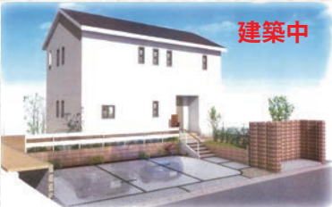
70-18 ユニバーサルホーム