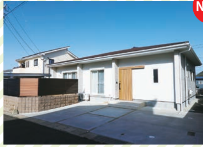
51-5 スムホーム お問い合わせ 095-842-0066