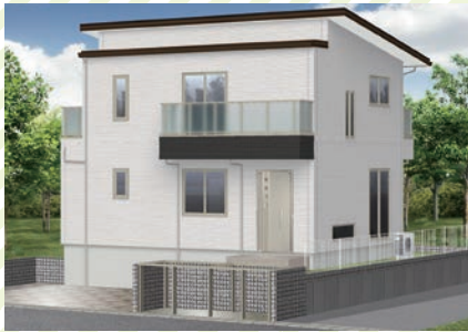
48-7 一条工務店 お問い合わせ 0120-110-275