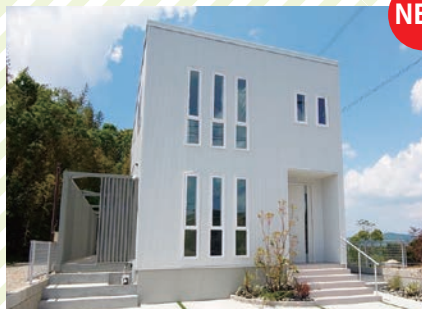
61-3 ユニテハウス お問い合わせ 095-847-1122