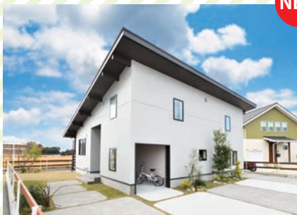
63-6 マイハウス お問い合わせ 0120-685-688