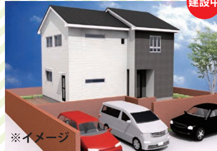
71-10 ユニバーサルホーム お問い合わせ 095-860-5555 7月完成予定