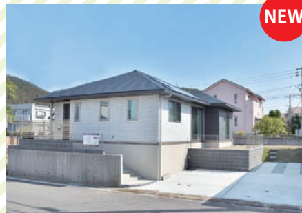
42-3 パナホーム長崎 お問い合わせ 095-828-6536