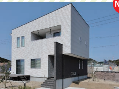
71-9 花丘建設 お問い合わせ 095-847-9841