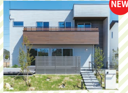
66-3 谷川建設 お問い合わせ 095-848-3551