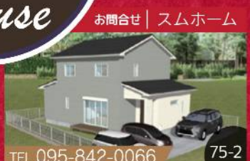
75-2 お問合せ | スムホーム | TEL 095-842-0066