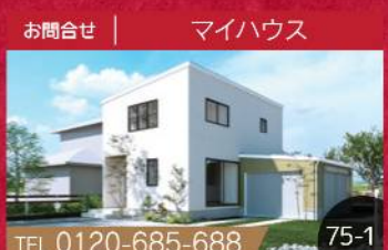
75-1 お問合せ | マイハウス | TEL 0120-685-688

●団地概要●所在地/長崎市豊洋台1丁目113-152他●交通/長崎バス平成15年4月7日団地内乗り入れ済●開発許可/長崎市指令開指第99号(平成19年2月23日変更許可)●開発面積/42.9h(429,172.41㎡)●総区画数/925区画(196,710.68㎡)●地目/宅地●用途地域/第1種低層住居専用地域、第2種低層住居専用地域、第1種中高層住居専用地域●建ぺい率/50%(第1種・第2種低層住居専用地域)・60%(第1種中高層住居専用地域)●容積率/80%(第1種、第2種低層住居専用地域)・150%(第1種中高層住居専用地域)●道路幅/12m・8m・6m・4m(歩行者専用)・アスファルト舗装●設備/上水道(長崎市営水道)・下水道(長崎市公共下水道)・電気(九州電力)・ガス(天然ガス・西部ガス)●地区計画/有●負担金/集会所建設負担金50,000円、CATV加入●工事完了年月日/第一期分譲区画完成平成14年11月、第二期分譲区画完成平成20年3月●事業主(売主)/東亜建設工業株式会社●設計施工/東亜建設工業株式会社●販売代理/東亜リアルエステート株式会社●物件概要●販売区画数/8区画●土地面積/646.51㎡[196.56坪](1区画)~343.67㎡[103.96坪](1区画)●販売価格/1,560万円(1区画)~2,620万円(1区画)●地目/宅地●用途地域/第1種中高層住居専用地域●建ぺい率/60%●容積率/150%●広告有効期限/2022年7月末日