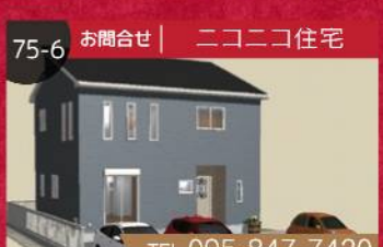
75-6 お問合せ | ニコニコ住宅 | TEL 095-847-7420