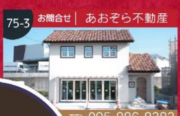
75-3 お問合せ | あおぞら不動産 | TEL 095-886-8383