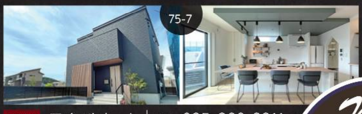
75-7 お問合せ アイフルホーム | TEL 095-860-2211